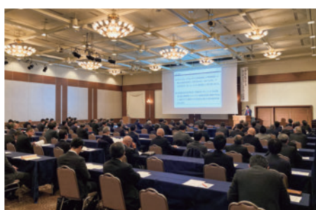
▲第一部 講演会の様子