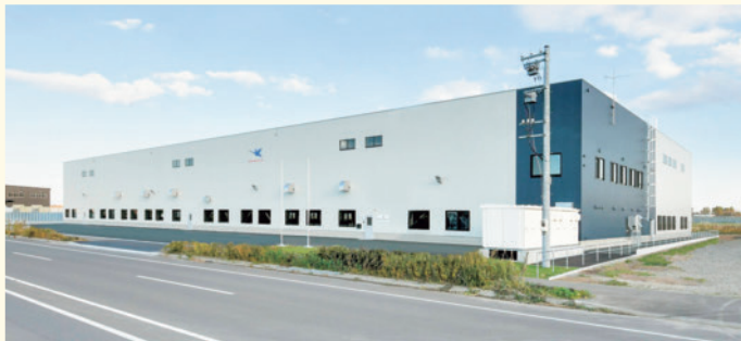
▲北海道工場兼札幌営業所

※ホイスト：重い荷物を持ち上げて運搬するために用いられる巻き上げ式のマテハン機械のこと