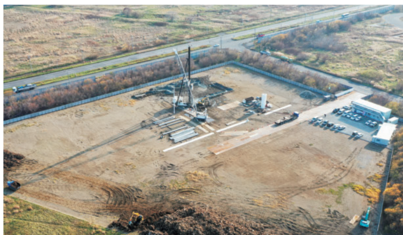
▲建設中の石狩地域バイオマス発電所

湾区域の一部(約500軒)洋上に設置され、単機出力8kWのS I M E N S G A M E S A R E N E W A B L E E N E R G Y 製風力発電機を14基設置され、総出力は11万2kWとなります。