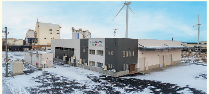
▲稼働を開始した北海道工場

昨年12月本格稼働を開始した北海道工場は、6,600平方メートルの敷地内に延床面積1,555平方メートル、地上二階建ての工場で、主にウィンドウォッシャー液やクーラント液、バッテリー液の製造を行っており、同社が取り扱う商品は全道各地のイエローハット店舗及びホームセンター・ドラッグストア等の量販店で販売されています。