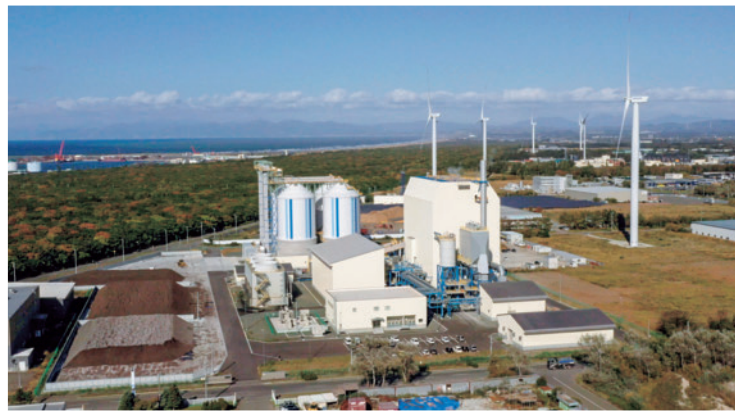
▲石狩新港バイオマス発電所

◆石狩湾新港地域では様々なプロジェクトが行われています 令和5年度の石狩湾新港地域内では、多数の企業進出があり、また、洋上風力発電をはじめとした、再生可能エネルギー施設や大型施設の操業等がありました。 また、地域内への交通インフラの整備が求められるなか、石狩市では、新たな軌道系交通の調査も行われています。 今号ではそれらの一部を紹介いたします。